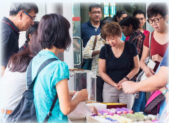
原稿提供 / 图：天主教艾滋病应对工作

据悉，有些华文团体的教友定期给患者讲授信仰道理，有些则带领歌唱，让他们以歌声抒发心情。