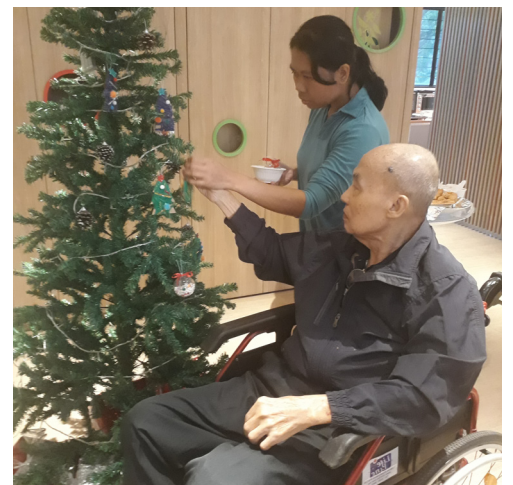
▲苏先生挂上装饰品

欲知更多详情，请电6801 7460或上网查询，网址： www.able-sg.org