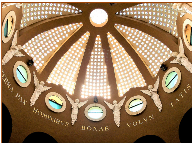
建筑、雕塑、文字营造出星光灿烂里，一队天军齐声赞颂天主的意象