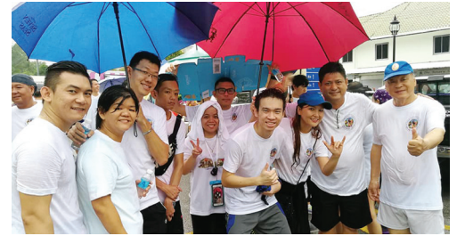
一群来自聋哑协会的会员完成“慈善竞跑”后与华语教务协进会副主席甲必丹拿督许中新（右）合照。

这次“慈善竞跑”虽然没有设下任何奖项，但由于这是为公益的善举活动，它仍然吸引了近三千教众，以及不分种族信仰的公众人士踊跃参与，间中也有多位来自聋哑协会的会员。